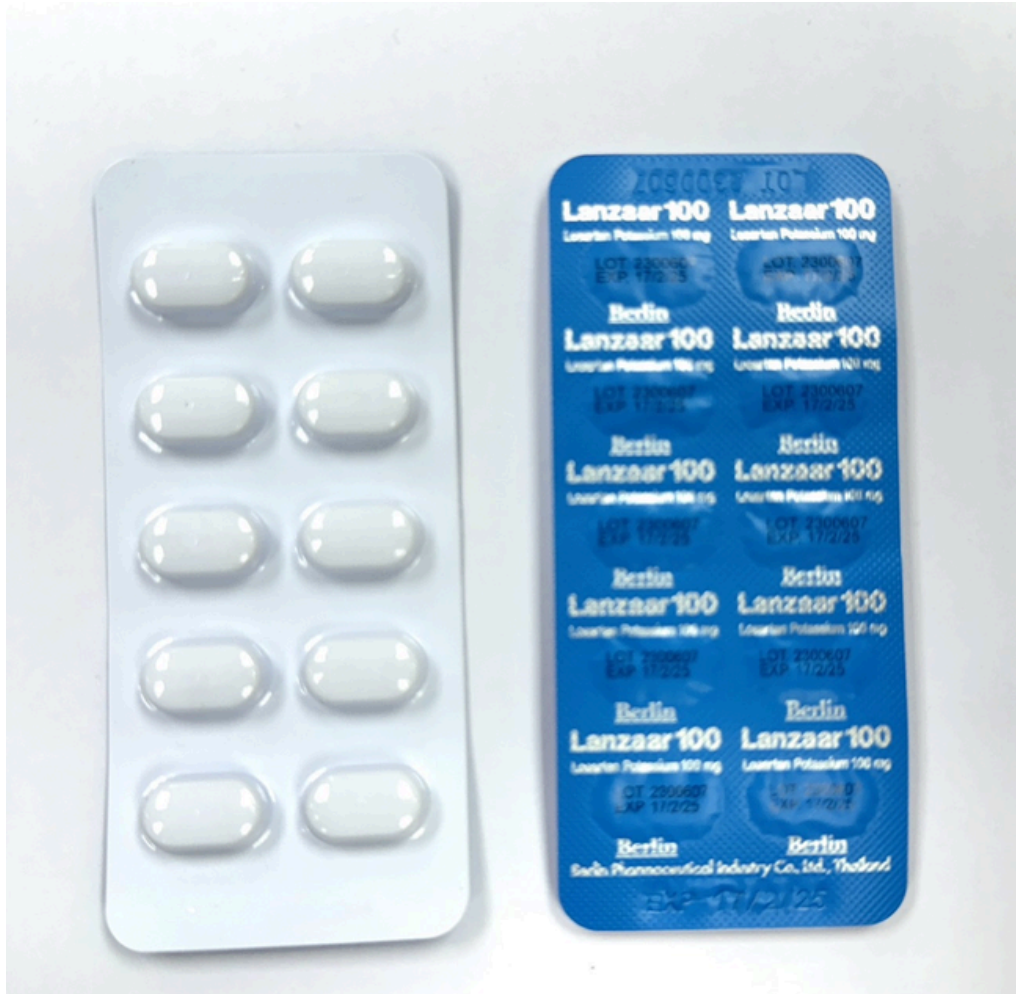
Losartan 100 MG.