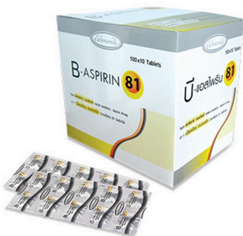
Aspirin Enteric -Coated 81 MG.