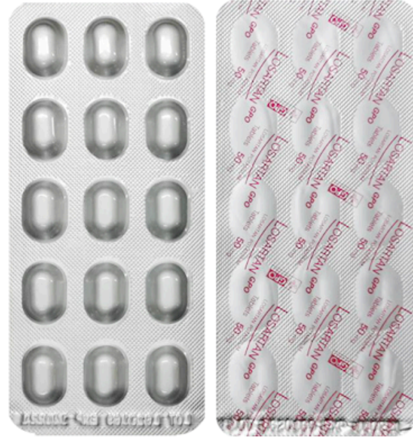
Losartan 50 MG.