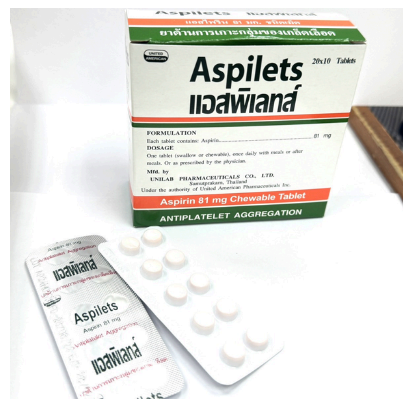
Aspirin Chewable 81 MG.